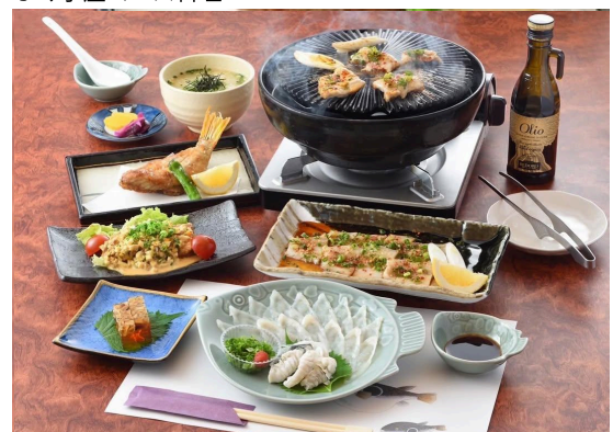
ふく小屋コース料理

A.まずは提供する料理のレシピづくりに力を入れました。高級なイメージの強い「ふく」を、もっと身近に、気軽に味わっていただけるよう工夫し、1人前6,600円（税込）のコースを設定しました。地元飲食店の方々にも試食をお願いし、サービス面のチェックも含めて多くのご意見をいただきました。こうした試行錯誤の結果、多くの方からご好評をいただき、卸売をはじめ販売拡大にもつながっています。