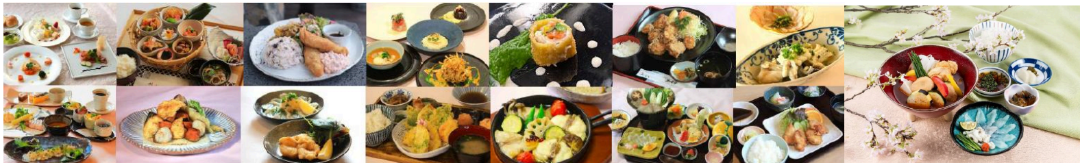
桜ふぐフェア料理 春帆楼（東京）